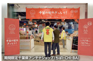
期間限定千葉県アンテナショップ(ちはい・CHI・BA)

この指針を基とした支援策の充実を図ることとで、一日も早い被災者の生活再建、産業の再生と本県の更なる地域振興に向けた取組を推進するとともに、市町村による復旧・復興に向けた取組を全力で支援してまいります。