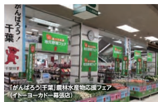
「がんばろう!千葉」農林水産物応援フェア(イトーヨーカドー幕張店)