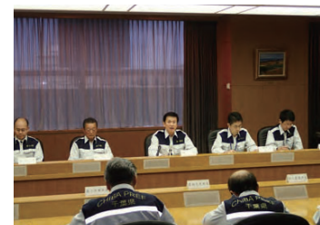
千葉県災害復旧・復興本部会議

当面の取組として令和3年3月（令和2年度）までを記載しています。 （※令和3年度以降については、復旧・復興の状況等を踏まえ検討）