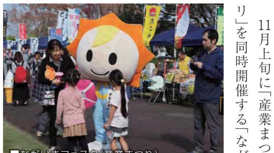
■ながいきフェスタ(産業まつり)

11月上旬に「産業まつり」と「C1グランプリ」を同時開催する「ながいきフェスタ」を村の尼ヶ台総合公園にて平成二十九年度から開催しています。