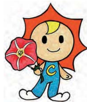
長生村イメージキャラクター 太陽くん